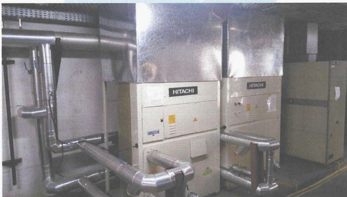
Ar condicionado instalado

Segue abaixo fotos dos equipamentos instalados: